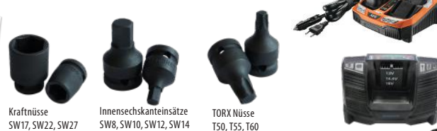
Kraftnüsse SW17, SW22, SW27